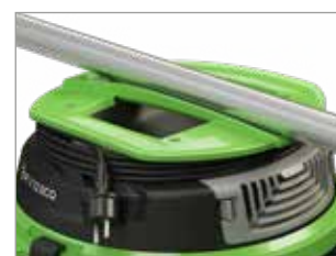
POIGNÉE ERGONOMIQUE AVEC ENROULEUR DE CÂBLE INTÉGRÉ