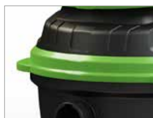
PROTECTION LATÉRALE CONTRE LES PORTES ET LES MURS